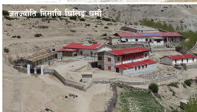
जनज्योति निमावि धिलिङ्ग घर्मी