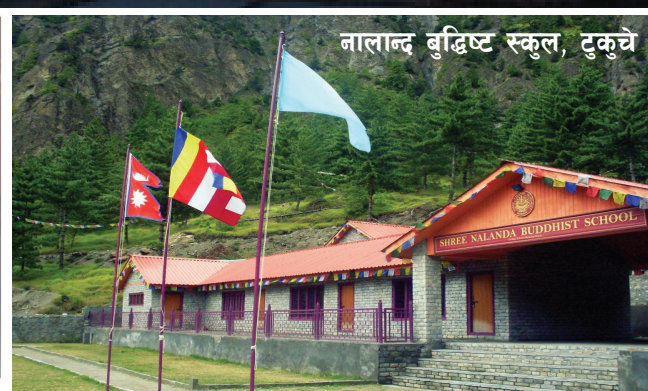
नालान्द बुद्धिष्ट स्कूल, टुकुचे