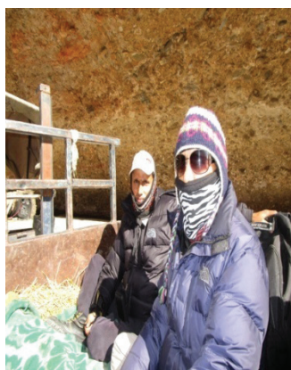
विद्यालय अनुगमनको क्रममा ट्याक्टरमा जादै