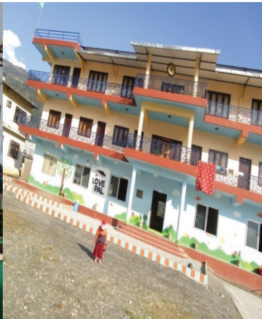
पाल एवं नम्याल गुम्वा भकण्डे पोखरामा