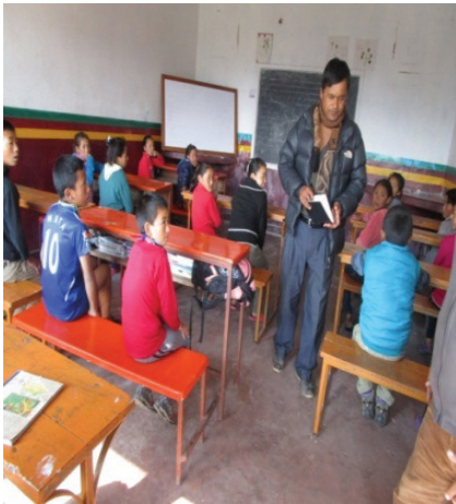
महाकरुण आ.वि. अनुगमन गर्दै श्रोव्यक्ति