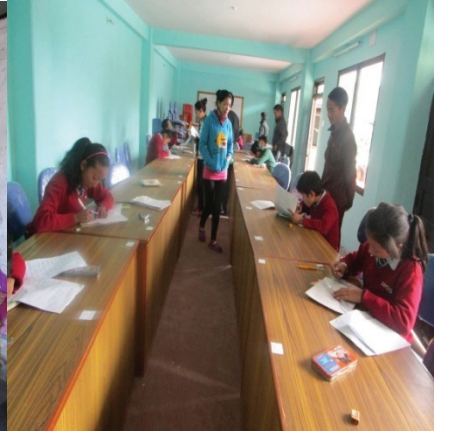
लोकुनफेनमा अन्तिम परीक्षामा संलग्न परीक्षार्थीहरु हेम्जा