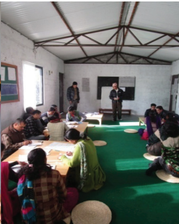
नवप्रवेशी शिक्षक तालिम पोखरामा