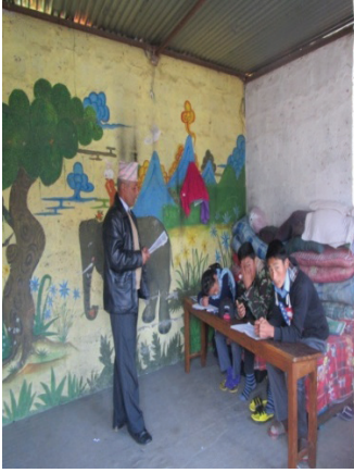
रा.नि.मा.वि. पढाउछै दिवाकरा सर