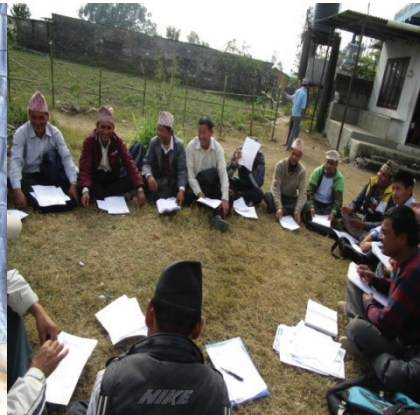
छोसेर प्र.अ. बैठक छोसेर