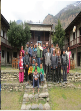
एकीकृत घुम्ती सेवामा संलग्न जिशिका कर्मचारी र शिक्षकहरु