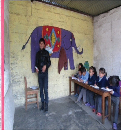
रा.नि.मा.वि. मा पढाउदै गौतम सर