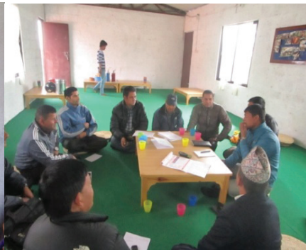
शिक्षक डायरी र शैक्षिक क्यालेण्डरका लागि पोखरामा बैठक