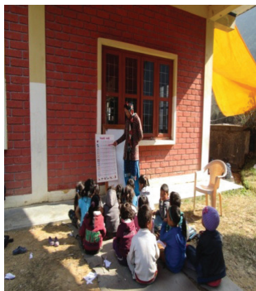
घुम्ती विद्यालयमा पढाउँदै सहनशिला