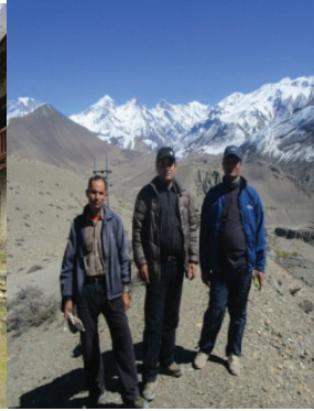
कागवेनी अर्न्तगतका विद्यालयहरु अनुगमनमा जादै जिशिका टिम