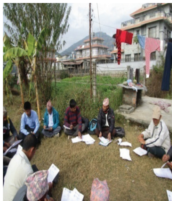
श्रोतकेन्द्र प्र.अ. बैठक पोखरामा