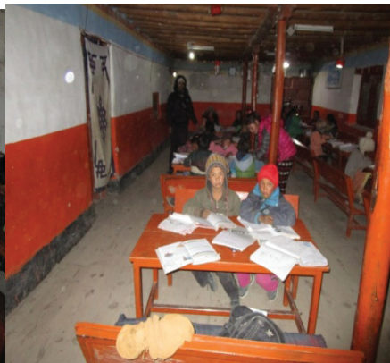
जनज्योती नि.मा.वि. घिलिङ कक्षा अवलोकन गर्दै विनि