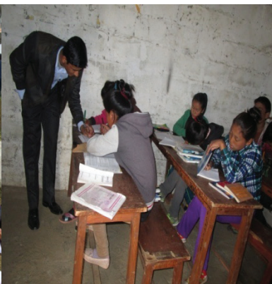
दिव्यदीप मा.वि. अंग्रेजी पढाउँदै शिक्षक