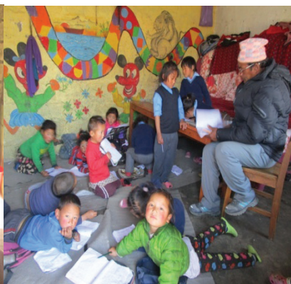
बा.वि.केमा पढाउँदै डिल्ली सर लोमन्याङ्ग